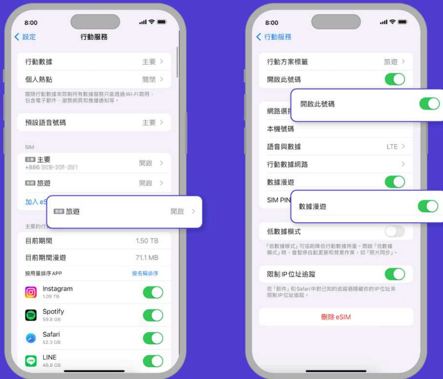
到達目的地後：開啟 eSIM 線路並開啟數據漫遊

確認已啟用eSIM後， 請前往設定、選擇Klook eSIM， 並在抵達目的地時開啟漫遊